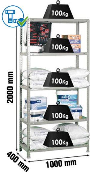
COMFORT PLUS 5/400 GRIS EAN: 8425437040863