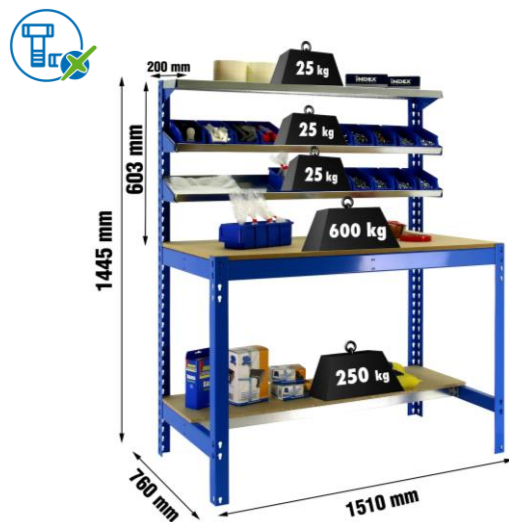
SIMONWORK BT1 1500 AZUL/MADERA EAN: 8435104919637