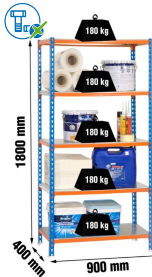
SIMONCLICK 5/400 AZUL/NARANJA/GALVA EAN: 8435104912690