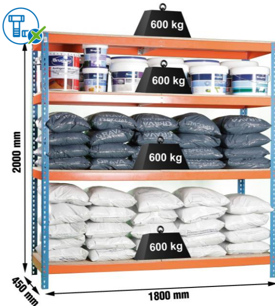
SIMONFORTE 1804-4 CHIPBOARD AZUL/NARANJA/MADERA EAN: 8435104925195